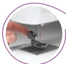
Piedini a sgancio rapido