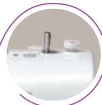
Avvolgi bobina automatico