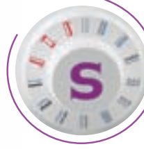
Facile selezione punti