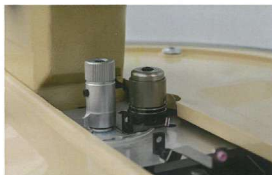
Gruppo tensione elettronica programmabile Programmable electronic tension unit