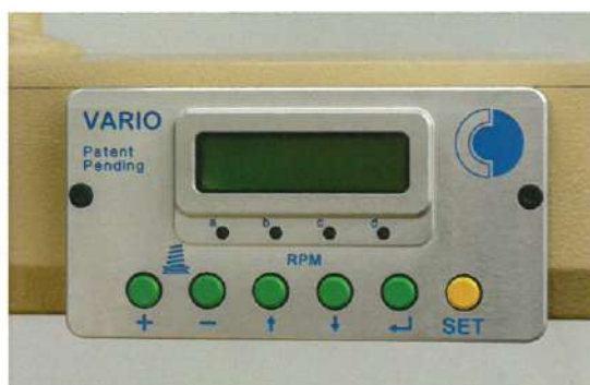
Pannello di comando Display